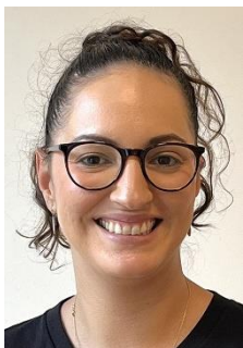
SHG Leiterin & Peer

Die Kombination von Selbsthilfetreffen und Peer-Gespräch kann der erste Schritt sein.