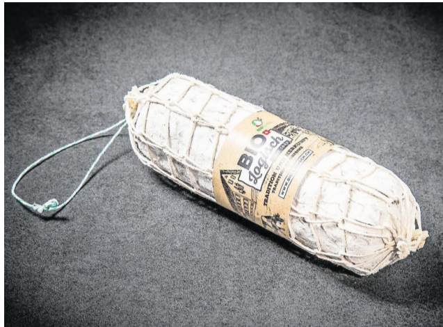
Die Vindonissa-Salami hätten sich in der Zeit der Römer nur wenige leisten können.